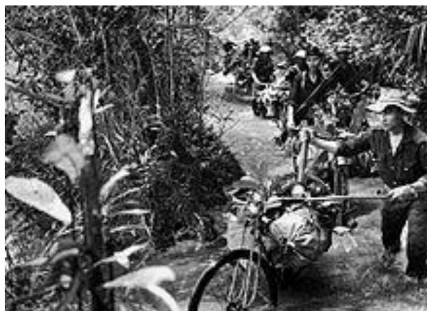
Рис. 4. Главным средством перемещения грузов был велосипед

В 1960 г. по территории Лаоса на западных склонах хребта Чыонгшон была проложена параллельная дорога протяжённостью 600 миль. Она строилась скрытно с полным соблюдением всех средств маскировки [Ван Тиен Зунг]. По ней двинулся поток носильщиков, доставлявших уже не только лёгкое оружие, но и разобранные на части артиллерийские орудия, миномёты. Лучшими работниками были местные жители из горных народностей, которые хорошо знали местность и были привычны к тяжестям. Вскоре на «дороге Чыонгшон» появились даже прирученные ими слоны, а затем грузы стали укреплять и на специально подготовленных велосипедах (рис. 4, 5).