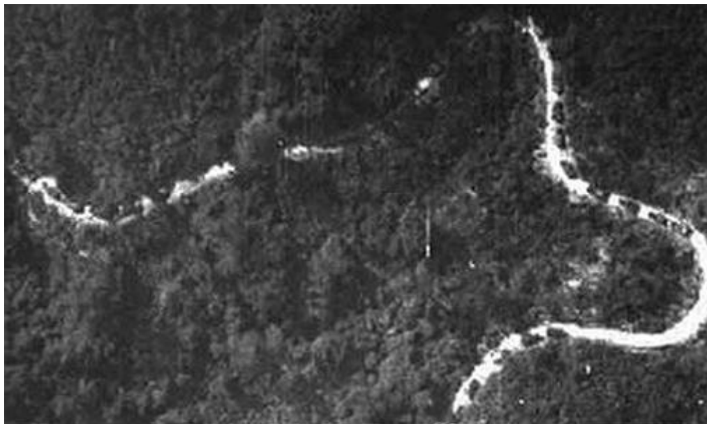
Рис. 1. «Тропа Хо Ши Мина». Вид сверху

Тогда же генеральный штаб ВНА образовал транспортную группу или «Команду 559» (цифровое обозначение – «май 1959 г.»), для начала – из сапёрного батальона «Б» в составе военных инженеров и молодых добровольцев. Им пришлось не только приступить к строительству дороги с помощью лопат и ломов, но и транспортировать на себе всё необходимое. Мускульная сила довольно долго оставалась единственной на «дороге Чьонпшон», как называли эту стройку. Сапёры были вооружены для самозащиты, но имели строгий приказ избегать столкновений с сайгонскими войсками и полицейскими, соблюдать строжайшие правила маскировки. Основным руководством строителей было: «идти, не оставляя следов, готовить еду без дыма, говорить так, чтобы не слышал никто» (рис. 2, 3).