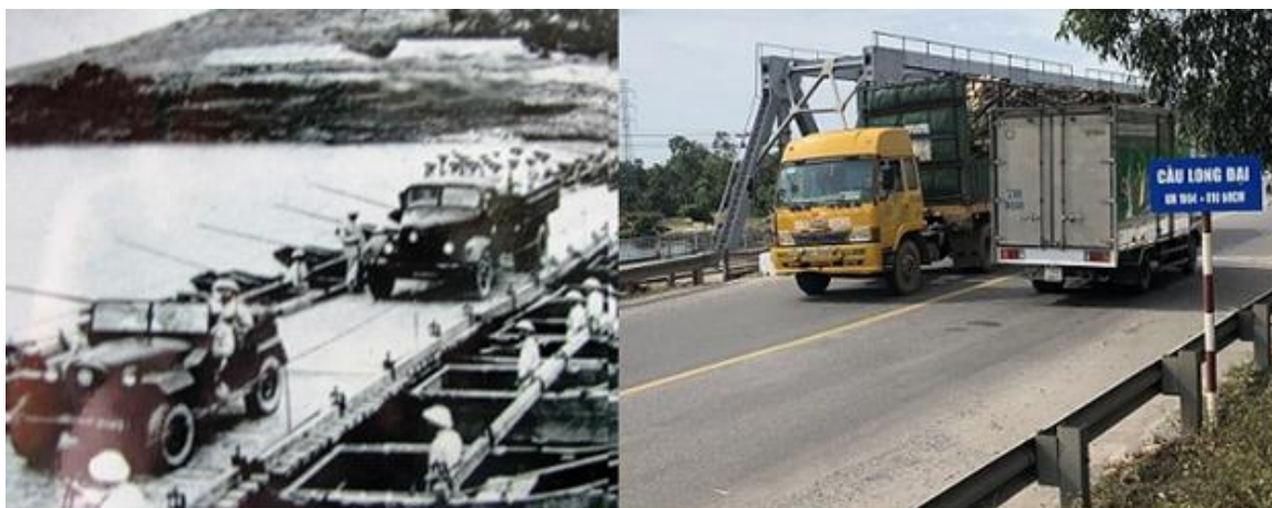
Рис. 10. Мост Лонг дай на «тропе Хо Ши Мина» (пров. Куангбинь) в 1975 г. (слева) и в 2010-х гг. (справа)