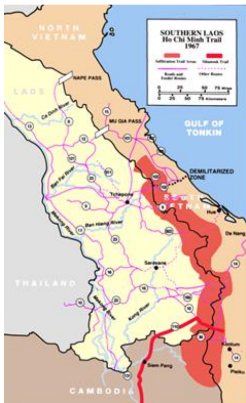
Рис. 6. «Тропа Хо Ши Мина» в Южном Лаосе, 1967 г.

Всё это происходило в сложной обстановке в граничащих с Вьетнамом Лаосе и Камбодже, которые на момент победы вьетнамцев над французами являлись монархическими государствами.