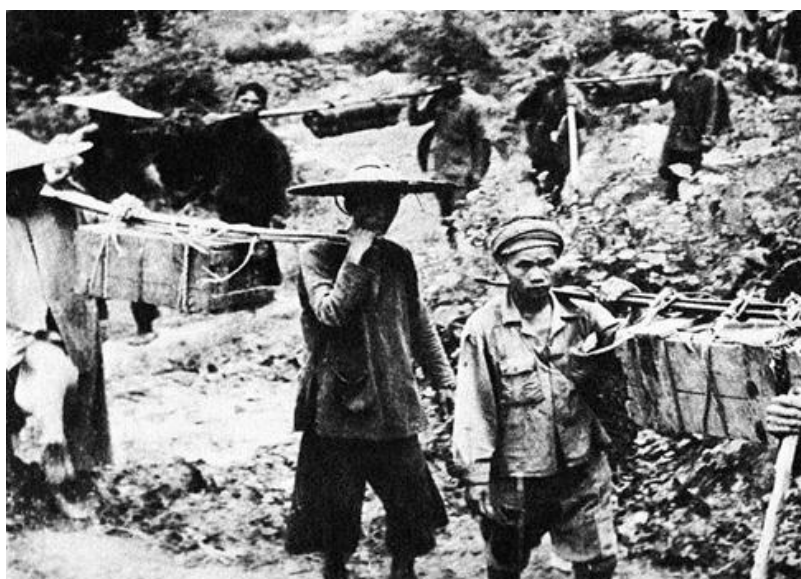
Рис. 2. Носильщики на «тропе Хо Ши Мина», 1959 г.

Тогда же генеральный штаб ВНА образовал транспортную группу или «Команду 559» (цифровое обозначение – «май 1959 г.»), для начала – из сапёрного батальона «Б» в составе военных инженеров и молодых добровольцев. Им пришлось не только приступить к строительству дороги с помощью лопат и ломов, но и транспортировать на себе всё необходимое. Мускульная сила довольно долго оставалась единственной на «дороге Чьонпшон», как называли эту стройку. Сапёры были вооружены для самозащиты, но имели строгий приказ избегать столкновений с сайгонскими войсками и полицейскими, соблюдать строжайшие правила маскировки. Основным руководством строителей было: «идти, не оставляя следов, готовить еду без дыма, говорить так, чтобы не слышал никто» (рис. 2, 3).