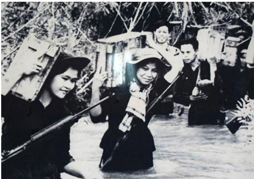
Рис. 3. Половину носильщиков составляли женщины

Дорогу начали прокладывать по старым пешеходным дорогам торговцев и охотников, которые использовались в годы войны с французами. В августе 1959 г. по ним уже начались поставки оружия и боеприпасов на Юг. К концу года, по сообщениям сайгонских властей, насчитывалось около 1800 человек, которые прошли по этим, тогда ещё действительно лесным тропам [Ван Тиен Зунг].