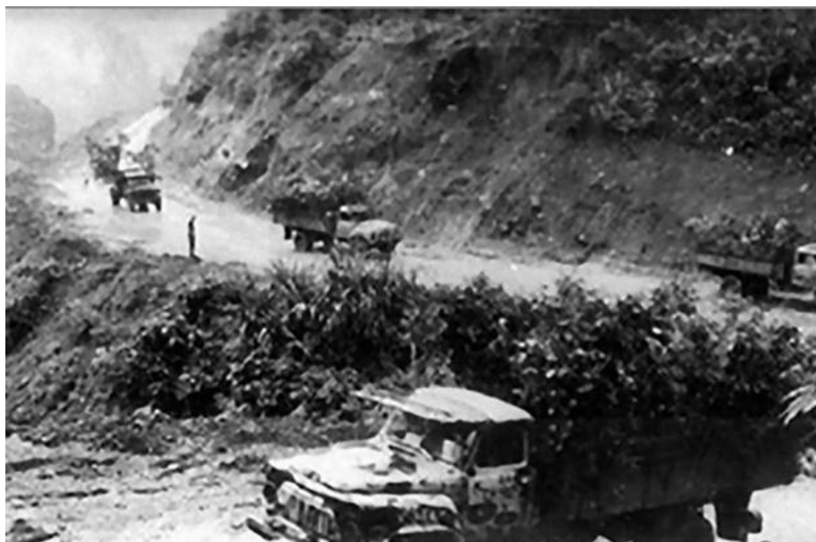
Рис. 9. «Тропа Хо Ши Мина» в 1970 г.

После подписания Парижских соглашений в 1973 г. бомбардировки «тропы» прекратились. К этому времени она уже превратилась в двухколейную дорогу, а в конце 1974 г. местами состояла из четырёх полос с параллельно проложенным трубопроводом и телефонной связью. Успех грандиозной по замыслу и исполнению весенней кампании ВНА 1975 г. был, несомненно, обеспечен огромной, самоотверженной и умело замаскированной подготовкой на протяжении полутора лет (рис. 9, 10).