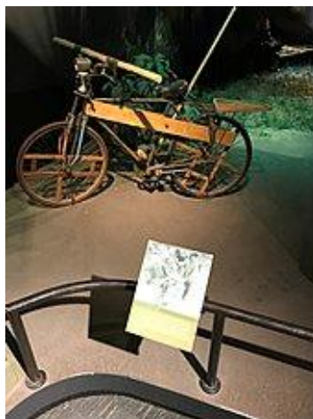
Рис. 5. Велосипед, приспособленный для перевозки грузов