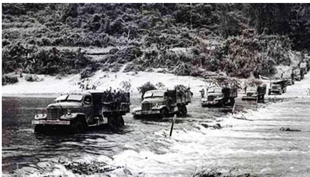
Рис. 7. Переправа на «тропе Хо Ши Мина»

Немалые потери личного состава и техники понёс и Вьетнам. Американские историки считают, что только в 1970–71 гг. за время сухого сезона их самолёты уничтожили 4 тыс. грузовиков. Хотя военной статистике трудно доверять всецело, очевидно, что потери на «тропе Хо Ши Мина» были действительно велики. Всего лишь один пример – караван «Зелёная стрела». Состоявший почти из тысячи тяжёлых грузовиков, он отправился в путь с Севера в начале 1966 г., ожидалось, что шести месяцев будет достаточно, чтобы проделать путь туда и обратно. Но караван вернулся на базу лишь девять месяцев спустя. В нём осталось только 280 машин, причём в очень плохом состоянии.